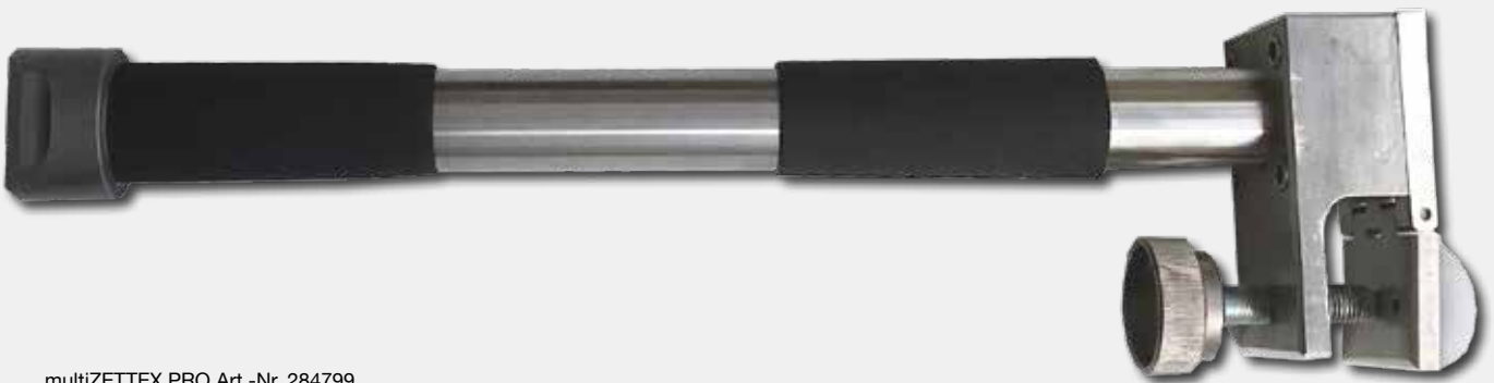
multiZETTEX PRO Art.-Nr. 284799

Durch die einfache Handhabung und den guten Einblick in das Ziehgeschehen ist die Fehlerquote stark minimiert. Zu dem benötigen die Einsatzkräfte eine kürzere Ausbildung auf dem multiZETTEX und dem multiZETTEX PRO .